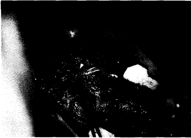
Fig. 1. Operative finding after exposure of the ruptured innominate artery