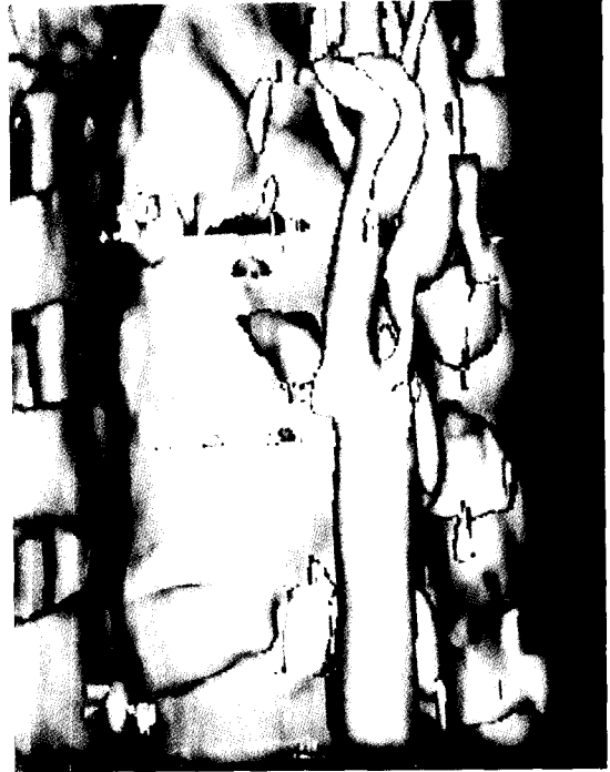
Fig. 1. SSD

(2) MIP(maximum-intensity-projection) Processing을 이용한 구성 방법은 XYZ축을 각도를 결정해 주면 해당 축에서 가장 밝은 CT