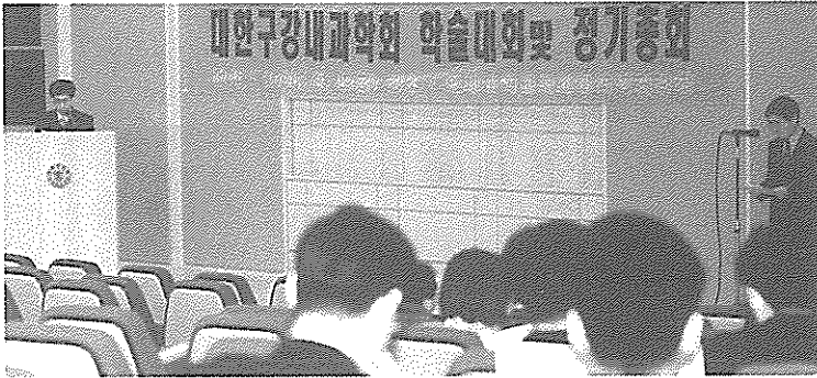
▲ 대한구강내과학회 정기총회

대한구강내과학회는 지난 8일 오후 6시 연세치대 강당에서 제25차 정기총회를 1백여 회원이 참석한 가운데 개최, 김영구 현회장을 유임시켰다.