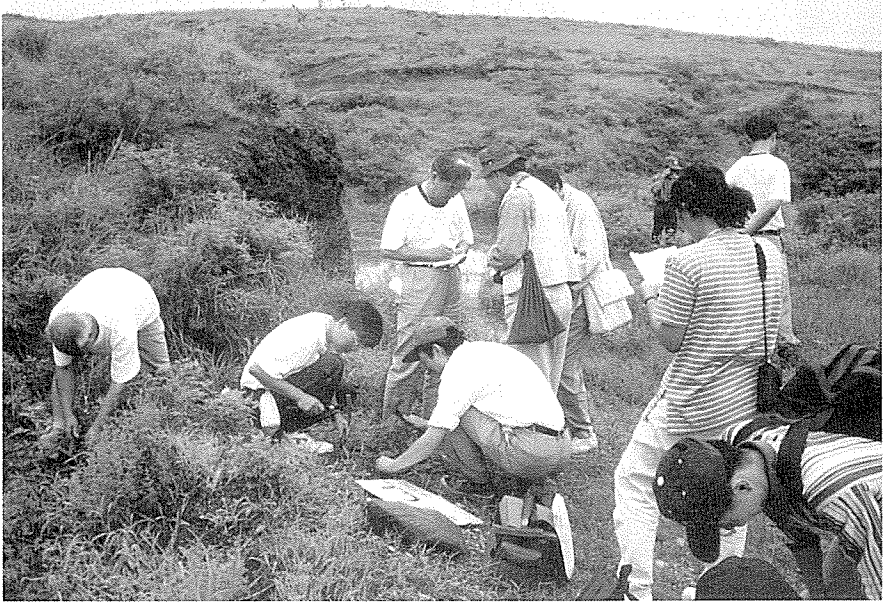
▲ 이번 학술발표회에 참석한 지질학자들이 총회기간중에 실시된 북경 서북방 백악기 퇴적층에 대한 야외 지질탐사에서 식물 및 패류화석을 채취하고 있다.