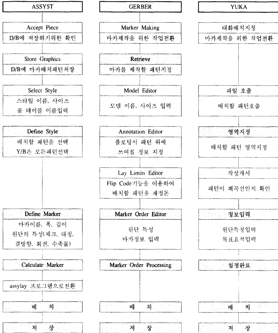
〈그림 3〉 시스템별 마카 제작을 위한 작업 단계(■: 시스템별 공통적인 작업)