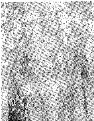
(그림 13) “와일드 원”의 마론 브란도 A History of Men’s Fashion, p.237.

한편, 50년대에는 10대 문제에 관한 영화가 요구되어 졌는데 반항아들의 이야기를 담은 영화 “와일드 원(The Wild One)”(1953), “워터 프론트(On the Waterfront)”(1954), “이유없는 반항(Rebel Without a Cause)”(1955) 등이 개봉되어 이런 반항의 이미지를 모방하려는 틴에이저들이 많이 생겨났고, 이는 50년대의 영패션에 중요한 맥을 이루었다. 영화 “와일드 원”에서의 마론 브란도(Marlon Brando)와 “이유없는 반항”에서의 제임스 딘(James Dean)의 남자다운 이미지가 가죽모터 싸이클 재킷과 리바이스 청바지와 티셔츠에 의해 즉각적인 매력을 나타내었다. 브란도의 ‘perfecto’모터 싸이클 재킷은 반항 젊은이의 상징이 되었는데 뉴욕의 스콧트 브라더스에 의해 만들어진 2차 대전시의 디자인에 기초를 두고 있다 21) (그림 13). 이것은 1950년대 말 젊은 남성들이 가장 많이 흥내낸 스타일 중 하나였다. 50년대 말경은 젊은 컬트 패션(cult fashion), 비트족(Beat)과 톤 업(Ton-up) 스타일이 생 로랑과 같은 진보적인 꾸뛰어에 의해 받아들여졌으며, 상류층 의류를 위해 세련된 하류층의 패션 아이디어가 패션이 역사에서 유일하게 받아들여진 시기였다. 영화가 폭력과 섹스로 난무해지자 기성세대는 영화에서