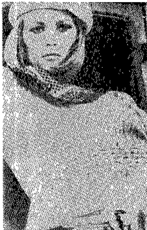
(그림 15) 페이 더너웨이의 보니룩 Leading Ladies, p.190.

60년대 중반의 미국 영화계는 다양성으로 활기가 두드러진 시기였다. 이 시기의 미국 영화는 젊은이들이 좌우하는 것 같았는데 더 도발적이고 자극적이며, 대담한 묘사를 하는 실험적인 새로운 영화의 장을 열었고 그 시대를 반영하였다. 이러한 시대적 상황 아래 패션도 선택된 여성들만의 것이 아닌 거리를 활보하는 불특정 다수의 여성을 위한 기성복, 즉 프레타 포르테가 오프 꾸뛰르를 위협하게 되었는데, 60년대 말까지 고급스러움과 화려함의 대명사 오프 꾸뛰르의 세력은 약화되어 가기 시작했다. 이제 영화로부터 패션이 탄생하는 것은 드문 것이 되었으나 이 와중에서도 “우리에게 내일은 없다”는 새로운 패션을 선보여 젊은이들로부터 호평을 받았다. 30년대 캐주얼 웨어를 입은 페이 더너웨이(Faye Dunaway)의 의상은 ‘보니룩(Bonnie Look)’이라고 하여 크게 유행하였는데, 베레모에 스웨터, 트윈드 스커트, 스웨터 안의 작은 스카프는 젊은 세대의 지지를 얻었다(그림 15). 이 스타일은 쉽게 따라 할 수 있는 코디네이트였으며, 고가의 옷이 아니었기 때문에 구입도 용이했는데 바로 이러한 의상 형태를 젊은