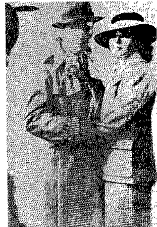
(그림 7) 잉그리드 버그만의 테일러드 슈트 Hollywood Movie Stills, p.112.

워너브라더스의 오리 켈리(Orry Kelly)는 “카사블랑카(Casablanca)”(1942)에서 잉그리드 버그만(Ingrid Bergman)의 의상을 맡았다. 버그만의 청초한 모습은 대중에게 크게 어필되었는데 버그만이 썼던 챙이 크고 끝이 약간 아래로 쳐진 모자는 ‘카사블랑카 모자’로 불리게 되었고, 테일러드 슈트와 함께 멋네기가 불가능했던 시대의 스탠더드 스타일이 되었다(그림 7). (그림 8)은 1943년 시어스 백화점의 테일러드 슈트의 광고이다.