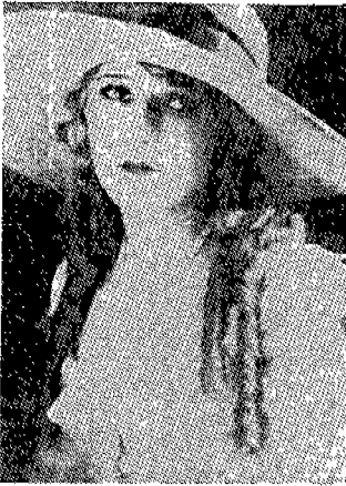
(그림 1) 메리 픽포드의 청순한 모습 Leading Ladies, p.21.