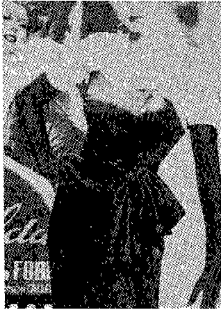
(그림 17) 헤이워드 스타일의 재현 Modain, no.92, p.39.