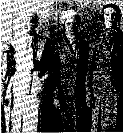
(그림 6) 가르보룩으로 치장한 여성들 (1931년) History of 20th Century Fashion, p.136.

로 폭발적인 인기를 누렸는데 많이들 선망했고 패션계 만들 수 있었다. 가장 유명한 백금 금발이었던 진 할로우는 영화에서 새턴으로 된 바이어스재단의 헬터 넥(halter neck) 가운을 입은 모습으로 유명하였다. 금발의 폭발적인 인기는 수천 명의 여성들이 그들의 머리를 표백하게 만들었다.