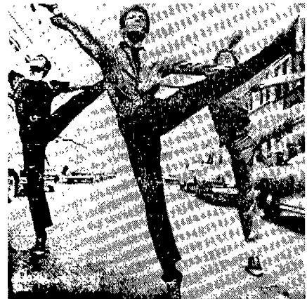
(그림 14) “웨스트 사이드 스토리”의 진즈 패션 A World of Movies, p.185.

60년대 초 주목받았던 영화의상은 61년 아카데미 의상상을 받은 “웨스트 사이드 스토리(Westside Story)”였는데 그 전까지 주로 모피나 새틴 이브닝 드레스가 나오는 작품들에게 수여되었던 것이 티셔츠와 진, 면 원피스, 데님 재킷 등에 수여되어 영화에서 응용된 일상 패션이 높게 평가되는 계기가 되었다. 22) 웨스트 사이드 스토리는 뒤에 올 진즈세대를 예언하고 있다고 할 수 있다(그림 14).