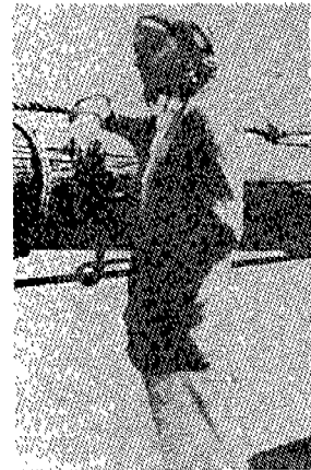
(그림 5) 그레타 가르보의 라이프 스타일 스크リーンモード女優たち, p.75.

가르보도 이 시대 여성들의 패션에 지대한 영향을 끼쳤다. 그녀의 고전적인 아름다움은 그 시대의 옷과 잘 어울렸으며, 테일러드 슈트와 코트, 벨트를 맨 트랜치코트는 어두운 안경과 베레 또는 슬라우치 햇(slouch hat)을 쓴 그녀의 스타일은 오늘날까지 많은 여성들이 40년전에 그녀가 만든 스타일을 따르게 하고 있다. 가르보스타일은 이마가 드러나게 베레모를 쓰고 가디간과 레인코트를 입은 그녀의 라이프 스타일(그림 5)이라 할 수 있는데 이 스타일은 20, 30년대의 주류모드이기도 했지만 가르보에 의해 더 유행하였다. 14) (그림 6)은 가르보스타일을 입은 여성들의 모습이다.