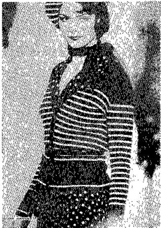
(그림 18) 보니룩 Modain, no.97, p.75.

90년대에 들어서 세계 패션 트렌드는 레트로 패션을 추구하면서 많은 디자이너들이 옛 할리우드 스타들의 스타일을 재현하고 있다(그림 17, 18). 그러나 더 이상 영화에서의 의상이 즉시 유행으로 이어진다면, 모방되어 지는 일은 없어지게 되었다.