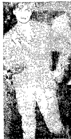
(그림 12) 사브리나 팬츠를 입은 여성 Fashion Source Book, p.113.

타로 브리짓트 바르도(Brigitte Bardot)를 들 수 있다. 이 시대 젊은 여성들의 모습에 가장 강한 영향을 준 사람은 브리짓트 바르도로 긴 금발, 얇은 화장, 반짝이고 도톰한 입술, 매니큐어에 속옷이나 스웨터를 입은 섹시한 이미지로 영화 “그리고 신은 여자를 창조했다(Et Dieu crea la femmc)”(1956)에서 젊은 오부역을 한 이후 세계적으로 폭발적인 인기를 끌었다.