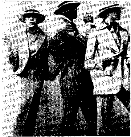
(그림 16) 1971년 빌 블레스의 보니룩 New York Fashion, p.245.

대중들은 원하고 있었던 것이다. (그림 16)는 1971년 빌 블라스(Bill Blass)의 보니룩 스타일이다.