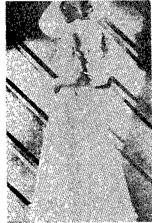
(그림 4) 조안 크로포드 스타일의 1934년 드레스 Costume & Fashion, p.245.