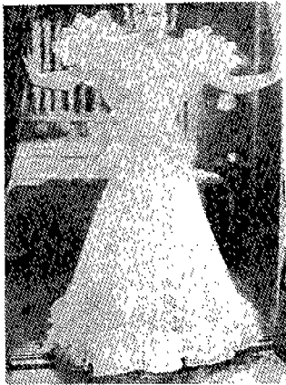
(그림 3) 조안 크로포드의 러플 슬리브 드레스 Costume Design in the Movies, p.7.

할리우드의 톱 디자이너 중 한사람이었던 길버트 아드리안(Gilbert Adrian)이 조안 크로포드를 위해 디자인한 의상들은 대중패션으로 크게 유행하였는데 특히 영화 “레티 린톤(Letty Lynton)” (1932)에서 조안 크로포드를 위해 디자인한 어깨가 넓고 허리가 많이 들어간 러플 슬리브의 흰 오간자드레스(그림 3)는 영화공개와 동시에 유행하