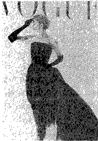
(그림 10) 리타 헤이워드스타일의 이브닝 드레스(1949년) The Art of Vogue, p.64.

45년 종전 후 수년간은 전후의 호황에 힘입어 할리우드도 영화 제작편수를 증가시켰고 전전수준을 회복하게 되었다. 이 시기에 공전의 히트를 친 작품으로는 리타 헤이워드(Rita Hayworth) 주연의 “길다(Gilda)”(1946)를 들 수 있는데 이 시기의 작품으로는 호화로운 것으로 영화에서의 의상도 큰 화제가 되었다. 프랑스의 디자이너 장루이(Jean Louis)가 디자인한 어깨 끈이 없는 검은 이브닝드레스와 팔목까지 오는 검은 장갑을 끼고 담배를 피우는 포즈(그림 9)는 많은 여성 관객들을 사로잡았고, 헤이워드는 이 한편을 통해 스타로 등단하게 되었다. 17) 그 후 약 20년간 이 드레스는 파티석상 뿐 아니라 어디에서나 카피되어지는 포멀 스타일로 정착되었다. (그림 10)은 1949년 보그지의 표지를 장식한 리타 헤이워드 스타일의 이브닝 드레스이다.