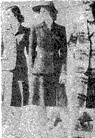
(그림 8) 테일러드슈트의 1943년 광고 카탈로그 Everyday Fashion of the Forties, p.44.