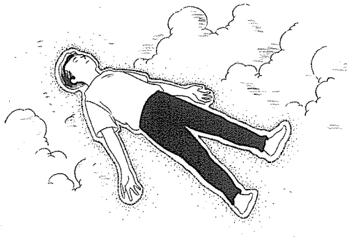
내 관 법