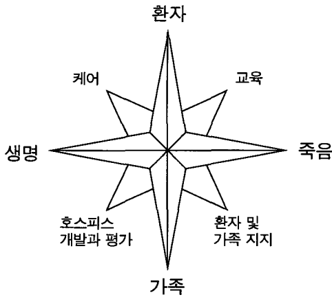
그림 2. 호스피스 케어 내용

또한 가족을 포함한 환자의 호스피스 케어 내용을 총괄적으로 도형화하면 다음과 같다. (그림 2)