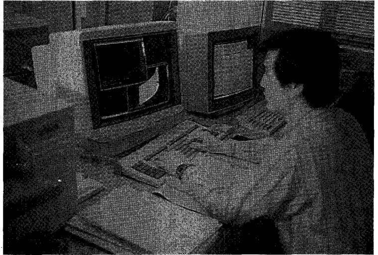
원자로 계통 설계 작업 모습

에도 불구하고 원자력발전소에 대한 지역 주민들의 불신과 피해 의식이 상존하고 있고, 특히 지방 자치제 실시 이후 원자력이 정치 문제화하는 경향을 보이고 있어, 향후 원자력 사업 추진에 커다란 걸림돌이 될 것으