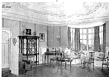
선생이 스크랩한 현대화된 실내장식과 가구