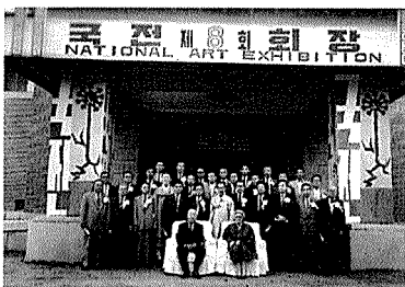
제8회 대한민국 미술전람회(국전) 이승만 대통령 내외의 참관기념 사진(앞줄 오른쪽에서 두번째가 선생)

해방과 더불어 한국 건축계는 현대건축의 태동기를 맞았는데, 당시 국가재건사업의 조속한 성취를 목표로 하는 사회적 분위기 속에서 현대건축에 대한 분석과 평가가 부족한 상태로, 성숙기에 해당하는 작품 제작에 최선을 다할 수밖에 없는 상황이었다.