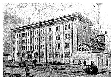
동아일보 본사 계획안

이 기간에는 현대건축의 이해보다는 현대건축의 생산에 진력할 수 밖에 없었다고 회고하였다.