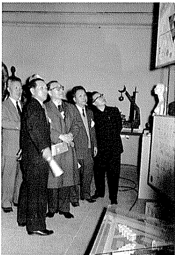
대한민국미술전람회(국전)에서 윤보선 대통령에게 건축작품을 설명하는 선생(좌측에서 2번째가 선생)

영국의 현대화 초기에 생겨난 멋쟁이 주의인 댄디이즘 신봉자들은 자기의 생활 전체를 바로 예술로 인식하고 자기의 일거수 일투족이 예술로 승화되는 것으로 생각하였었는데, 이들과 유사하게 선생은 유독 자기 자신만을 위한 멋쟁이(?) 에고이스트로서, 생활의 모든 면에서 현대적인 것을 즐기는 모더니스트였다. 이러한 선생의 습성은 건축활동에도 표출되는데, 외국여행시 정열적으로 수많은 최신 건축물을 견학하고 사진을 찍어서, 귀국 후 그 장점을 취하여 국내 작품에 그 특징을 활용하려고 부단한 노력을 경주하였다.