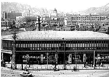
루버를 채용한 『신신백화점』

선생의 일생을 통한 정열적인 건축활동은 현대건축을 수용해야 하는 한국 건축계는 물론 정부의 국가재건 사업에 크게 이바지하는 업적을 남겼다. 일제치하의 한국 건축계에는 박길룡선생의 『경성박길룡건축사무소』가 개설되어 미약하나마 침체되어 있던 한국 건축계의 중심적 역할을 담당하였다. 그러나 해방 후 한국 건축계는 많은 어려움 속에 좌표설정도 하지 못하고, 건축인 자신들의 활동영역 및 권익보호도 확보하지 못하고 있었다.