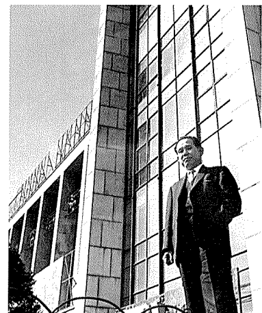
우남회관 앞에 선 선생

당시 선생은 정부의 국가재건사업에 직접 관여하여 한국 건설계의 활동을 위한 법령의 작성 작업을 수행하였는데 이것은 한국 건축계에 중사하는 건축인들의 권익증진에 토대를 마련한 계기가 된 것이다. 또 한국건축작가협회를 창설하여 한국의 건축계가 건축학회, 건축사협회, 건축작가협회로 분리되게 하고, 건축인들의 전공특성 및 기호에 따라 협회별로 참여, 활동할 수 있도록 한국 건축계를 정비하는데도 중심역할을 담당하였다.