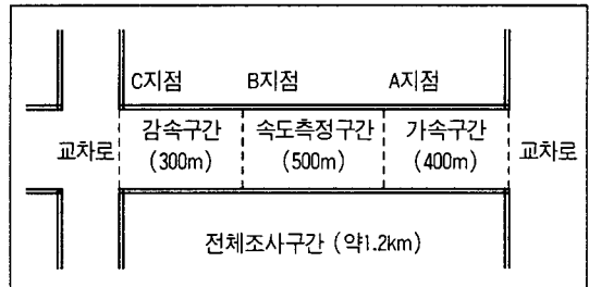
<그림 1> 조사구간 개요도

현장조사는 1997년 6월말~8월초까지 수행되었으며, 조사시간은 우기를 피하고 날씨가 맑은 날을 선정하여 도로의 노면이 건조한 상태에서 조사를 실시하였다. 조사시간대는 오전과 오후 첨두시간대인 경우에는 안정된 교통류를 형성하기 어렵기 때문에, 이를 피하여 오전 11시경에서 오후 3시경까지의 자료를 수집하였다.