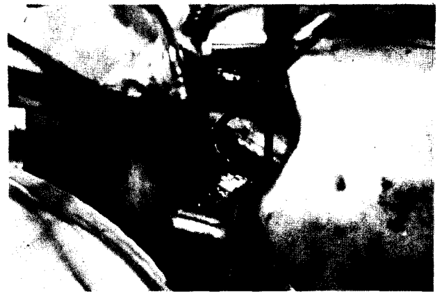
Fig. 2. Surgical view

현재의 보편적인 개심술방법은 정중흉골절개, 심폐우회술, 심근보호로 요약될 수 있다. 전(全: full) 정중흉골절개는 심장판막, 관상동맥을 포함한 모든 심장내외부 및 주변 구조물의 동시접근을 가능케 하는데, 이는 충분한 시야확보와 안전성이 심장수술의 가장 중요한 요소들이란 점을 감안할 때 목적에 잘 부합되는 수술원칙이라 할 수 있다. 특히 재수술이나 복잡심기형 교정 등 수술이 복잡해 질수록 상기 원칙은 필수적이라 할 수 있다. 최근들어 덜 침투적인 수술의 개념이 외과의들 사이에 관심의 대상이 되기 시작하면서 복강내시경 또는 흉강경 등을 이용한 수술방법과 수술기구의 발전에 힘입어 시도되기 시작한 소위 최소침투적심장수술(minimally invasive cardiac surgery)이 외과적인 외상(surgical