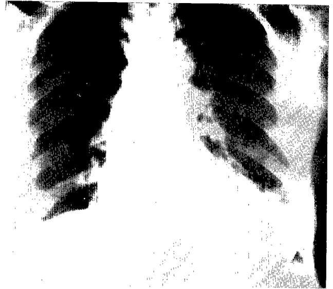
Fig. 3. Postoperative chest PA view