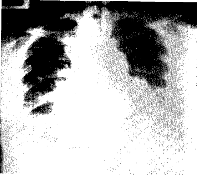
Fig. 1. Preoperative chest PA view