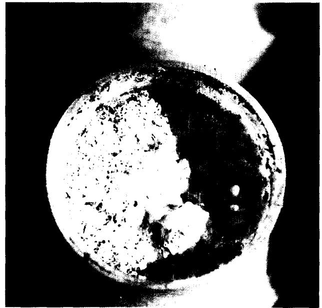
Fig. 2. Damaged mushroom fruit-body formation by Bradysia sp. in mushroom growing room constantly maintained at 4°C.

산란된 알은 깨끗한 백색의 쌀알같은 모양으로 대개의 경우 군집형을 이루어 산란을 하지만 길게 연결된 사슬형이나 곳곳에 흐트러져 낳는 분산형의 산란 양식도 보인다. Brar (1989)는 Bradysia tritici (COQ)의 생태에 관한 연구에서 성충은 일반적으로 아침에 우화를 하고 교미전기간, 산란전기간, 산란기간, 산란후기간은