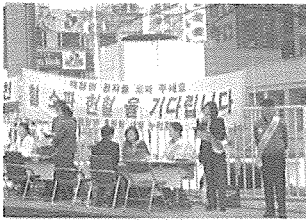
▲ 혈소판 헌혈 가두 캠페인 장면

치료 중인 환우들이 자원봉사를 함으로써 병에 대한 고통을 이해하고 같은 처지의 환자들에게 조금이라도 도움이 되고자 노력하고 있다.