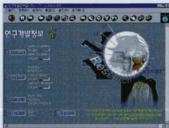
〈그림 4〉 연구개발정보 초기화면

98년 3월말 현재 46,368건이 등록되어 있으며 프로그램별, 저작자별, 적용분야별, 주요기능별, 등록기간별 등으로 검색할 수 있다. 또한 지적재산권에 관한 법령, 판례, 용어해설, 법해설, 자료실, 상담실, 최신뉴스동향 등이 서비스된다.