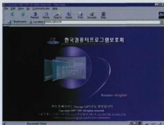
〈그림 3〉 프로그램보호회 초기화면

소프트웨어 지적재산권 관련 국내외 법령 및 협약, 용어 및 해설, 판례, 최신동향, 저작권상담, 프로그램등록내역 등 S/W지적재산권 관련 정보를 수록하고 있는 데이터베이스이다. 크게 프로그램등록 DB, 위탁프로그램등록DB, 기타지적재산권정보 DB로 구분되어 있고 인터넷 및 PC통신망을 통하여 이용자에게 신속 정확하게 제공함으로써 S/W지적재산권 침해 및 분쟁을 사전 예방하고 S/W 저작권자의 편의 및 S/W이용촉진을 도모할 목적으로 제작된 데이터베이스이다.