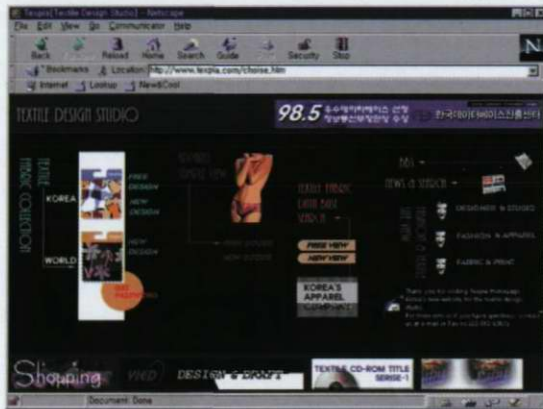
(그림 1) 텍스피아 초기화면

■ 현재 텍스피아에는 디자인외에도 약 1천6백개의 국내 브랜드 업체가 데이터베이스로 수록되어 있어 영업 활동에도 많은 이점을 제공함