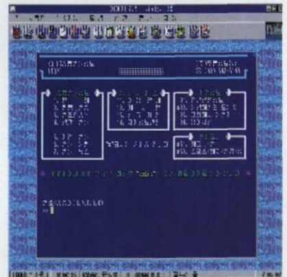
<그림 6> KOLIS 종합법률정보 초기화면

법조계는 인사이동, 개업, 이전, 유학, 논문 발표 등 항상 유동적이고 변동사항이 많아 책으로 볼 수 있는 정보에는 한계가 있다. 법조인명록은 이러한 법조계 동향을 빠르고 정확하