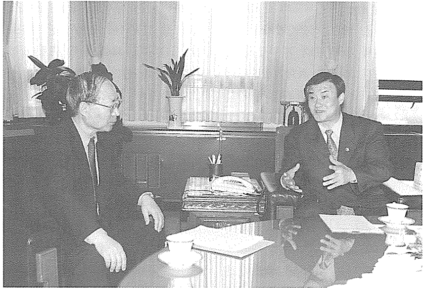
▲ 姜昌熙 초대 과학기술부장관(우측)이 李光榮 본지 편집위원에게 취임소감을 이야기 하고 있다.

우리나라 이공계 정부 출연연구기관은 지난 66년 한국과학기술연구원(KIST) 설립 이래 우리나라의 과학기술 발전을 선도해 오면서 경제·사회발전에 결정적으로 기여해 오고 있다고 생각합니다. 앞으로도 과학기술개발에 있어서 정부 및 공공 부문이 담당해야 할 역할이 계속