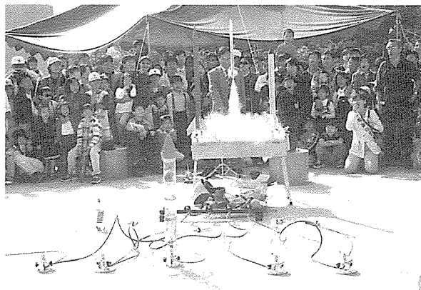
▲ 온가족 로켓만들기

국립서울과학관(관장 金大錫)은 지난 10월 18일 온가족 로켓만들기, 신나는 과학실험, 과학퀴즈 동서남북, 과학매직쇼, 핸드글라이더만들기 등의 다채로운 내용으로 '과학 한마당' 축제를 개최했다. 6천7백여명이 참여한 가운데 성황리에 개최된 '과학 한마당' 축제에서 참가자들은 수업이 아닌 놀이를 통해 과학을 즐기면서 꿈을 키우는 기회를 가졌다. 국립서울과학관은 최근들어 관람객의 증