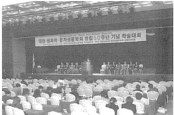
▲ 대한 생화학·분자생물학회 창립 50주년 기념 학술대회 모습