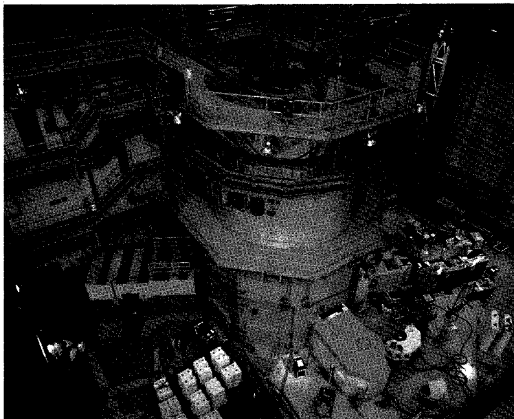
다목적 연구용 원자로 「하나로」, 21세기를 향한 우리 원자력산업의 국가 비전은, 원전을 국가의 주요 에너지원으로 지속 개발함과 동시에 원전 기술을 장래의 국가 유망 수출 산업으로 개발하는 것이다.

이에 힘을 얻어 안전성 및 경제성을 획기적으로 개선하여 2010년 이후 표준형 원자로로 사용할 대형 발전용 가압경수로(1,300MW급)인 KNGR를 국가 선도 사업으로 개발하고 있