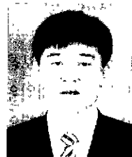
장 세 국

무엇보다도 중요한 점은 리눅스의 채택이 이러한 특정 부분의 서버로서의 역할이 아니라 엔터프라이즈 서버(Enterprise Server)로서의 역할을 하기 위해서는 SMP 또는 MPP로서의 성능 향상과 이에 따른 클러스터링 기술, 그리고 이러한 환경에서 운용될 수 있는 다양한 애플리케이션의 개발과 보급이 필요하다. 현재는 기초적인 접근 방법으로 단지 MS-Windows에서 제공하는 기능을 Linux에서도 똑같이 제공하므로써 MS-Windows에 익숙해져 있는 사용자들을 Linux로 전환하기 위한 접근 방법을 취하고는 있지만 커널차원에서의 이러한 노력도 필요한 부분이다. 전사적차원에서의 Linux활용을 위하여 오라클에서는 데이터베이스 서버이외에도 윈도우개발툴(Motif용)과 ERP등을 현재 개발 진행 중에 있다.