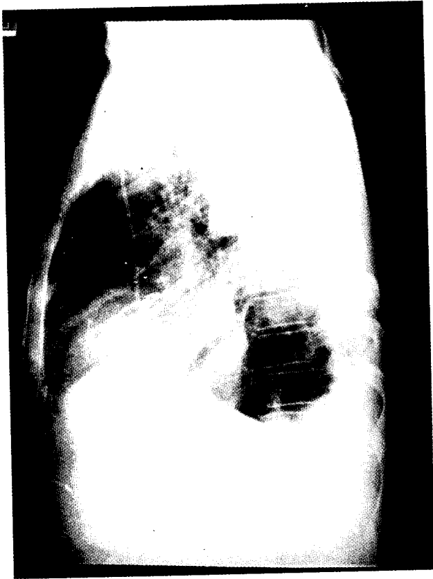
Fig. 1. Chest lateral view. Knotted pulmonary artery catheter is noted in right atrium.