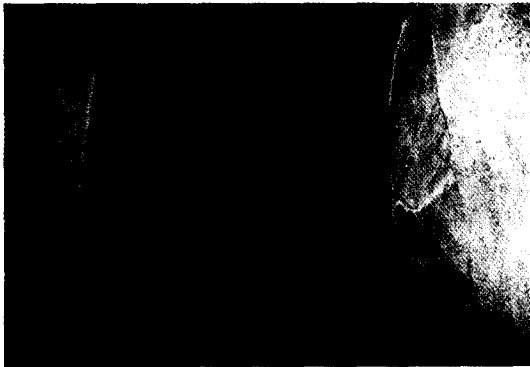
그림 6. 지상3층 계단에서 본 지상4층 가정집 출입구(방화문).