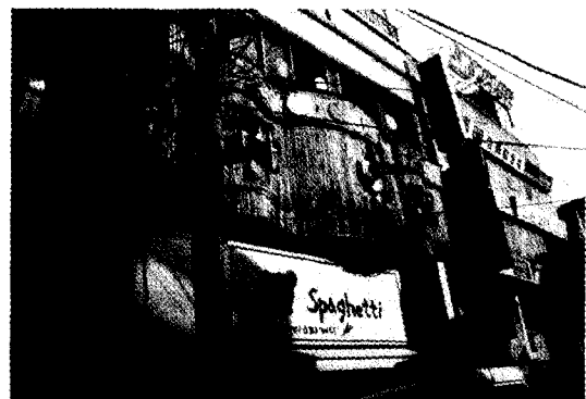
그림 1. 화재발생 호프집과 동일한 형태의 건물전경.

- 실내에 있는 의자와 테이블은 불박이 고정식으로써 바닥에 볼트로 고정되어 있으며 테이블과 테이블 사이의 경계는 원통의 파이프를 U자형으로 접어서 바닥