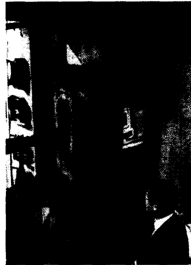
그림 3. 2층 계단의 호프집 출입구 화재 전소 사진.