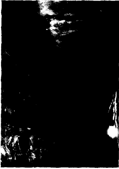
그림 9. 지하 1층 노래방 출입구 최초 화염 전파 경로 전경(전소).