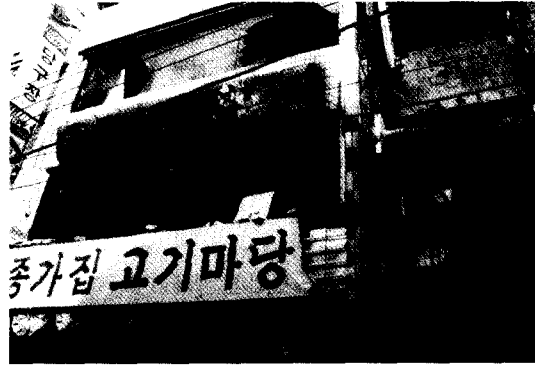
그림 7. 호프집 외부 유리창 파쇄 전경.

이날 화재를 처음 발견하고 신고한 목격자가 “길을 가는데 4층 건물의 지하실인 노래방에서 검은 연기가 치솟으면서 잠시후에 옷에 페인트가 묻은 젊은이가 지하에서 먼저 뛰쳐나왔다”라고 증언 한 것으로 보아 불은 지하 노래방에서 처음 발생한 것이 명백하였다. 다만 지하에서 뛰쳐나온 피해자가 황급히 불을 피해서