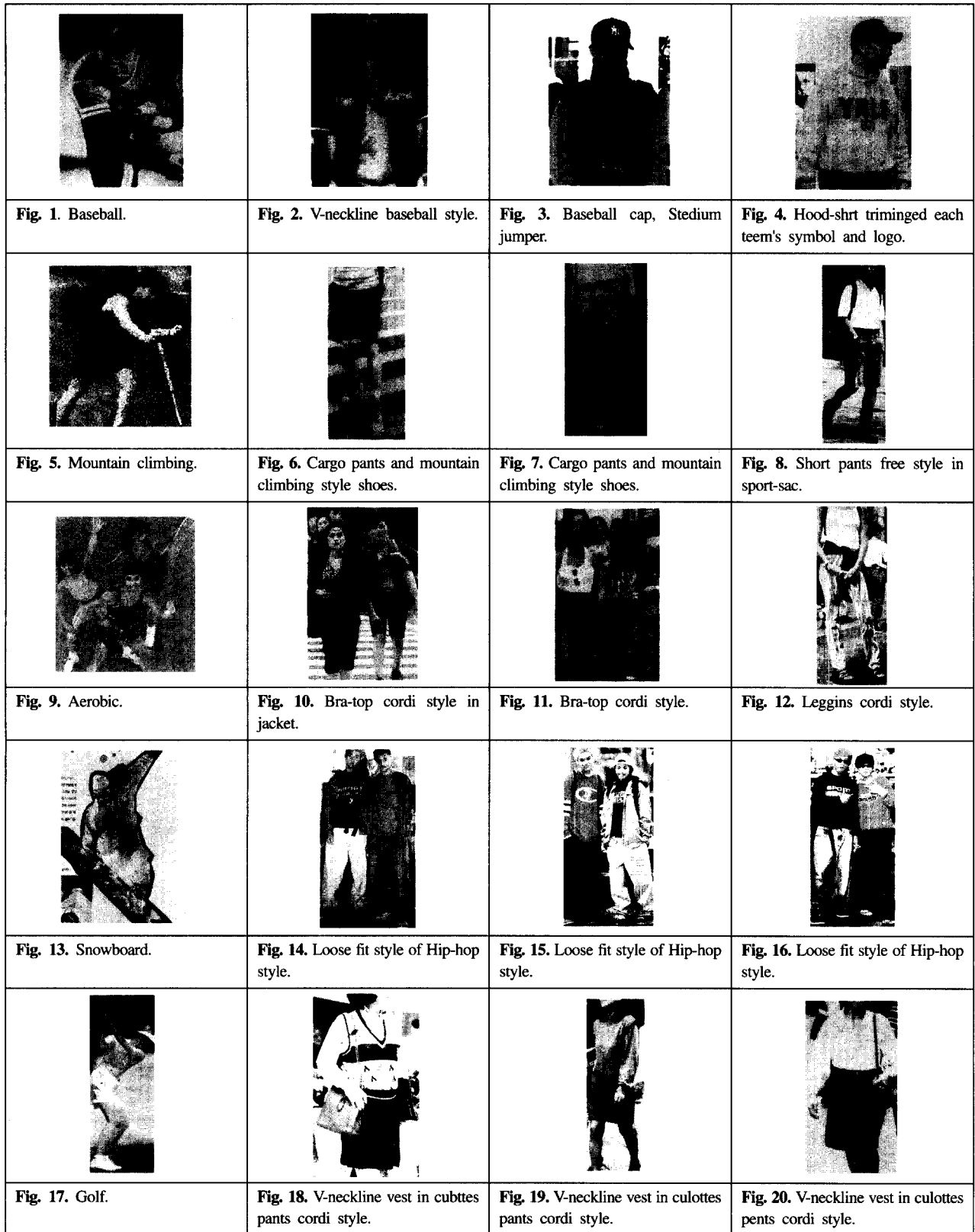
Figs. 1~20. Influence of mass fashion design factor in sportswear.