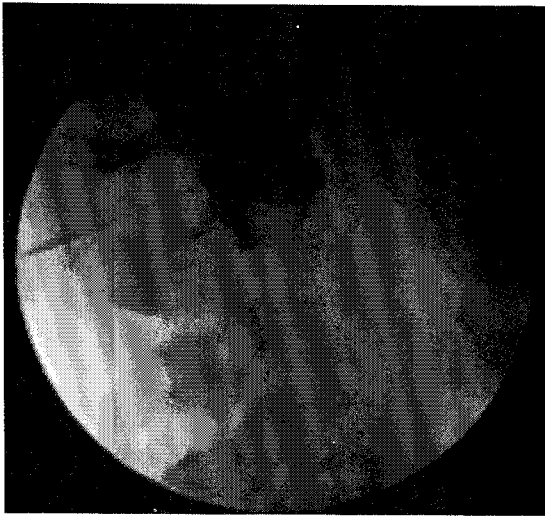
Fig. 2. Lateral radiograph showing the needle position and contrast spreading in the capsule of atlanto-axial joint.