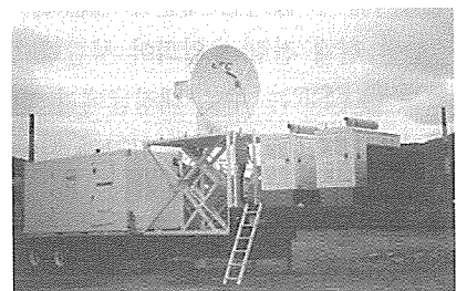
<그림 1> 첨단 기상측기 중 하나인 이동식 기상레이더

이상 기상현상을 정확히 파악하고 그 변동을 정확하게 예측하기 위해서는, 광대한 지구가 다양한 변동을 구성하는 개개의 요소과정을 상세히 해명하고 각각이 서로 복잡한 영향을 미치게 하는 지구를 종합적인 시스템으로서, 시·공간적으로 변모를 충실히 재현하는 노력이 필요하다. 이 때문