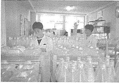
▲ 2~5리터 배양용기에서 배발생세포를 배양하는 모습

특히 이런 조직배양 방법은 완전 무공해 제품을 생산할 수 있고, 6년이나 걸리는 자연적 재배에 비해 시간(3개월)과 공간의 제약을 받지 않고 원하는 양을 원하는 시기에 생산할 수 있다는 장점을 가진다. 더욱이 현재의 Shaker를 이용해서 현탁 배양하는 방식은 배양기간이 90일 걸리고 하루에 3.5Kg 정도만을 생산할 뿐이지만, Bio-reactor로 생산하면 배양기간도 반으로 단축할 수 있을 뿐 아니라 생산량을 몇 배로 증가시킬 수도 있다.