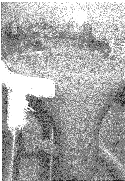
▲ 5리터 용량의 배양기(Bio-reactor)에서 배양시켜 성장시킨 유식물체

양한 다음, 이 증식된 세포들을 체세포배발생 과정을 거친 결과 뿌리와 잎을 갖춘 유식물체(싹이 튼 상태의 어리고 작은 식물체)를 얻는데 성공했다. 우선 가시오갈피나 인삼의 조직에서 떼어낸 배발생 캘러스(callus, 세포덩어리)를 한천(고체)배지에서 배양하다가 증식속도가 빠른 캘러스를 선발하여 액체배지에서 배양하면 배발생세