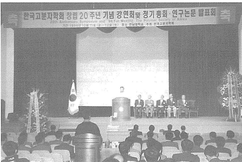
▲ 창립 20주년 기념 강연회 및 정기총회·연구논문 발표회 모습

상임위원회에는 자문위원회, 재무위원회, 기금관리위원회, 산학협동위원회, 용어제정위원회, 학술편집위원회, 영문편집위원회, 기술편집위원