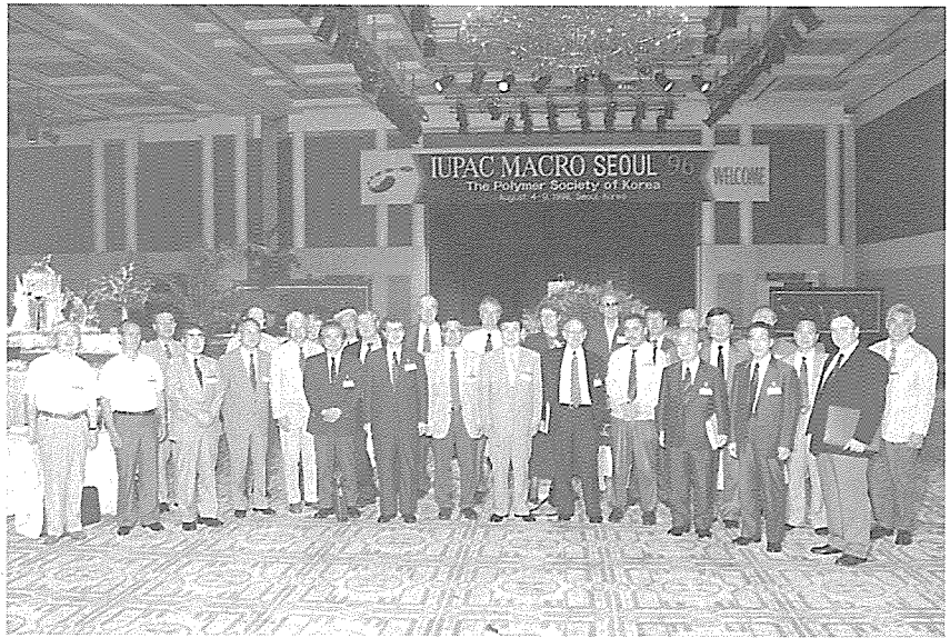
▲ 'IUPAC MACRO SEOUL '96' 을 마치고

고분자 산·학·연 심포지엄은 산업 현장, 대학, 연구소 공동으로 고분자 산업 분야에 대한 주제 발표와 토론을 통하여 업계의 발전방향 및 현재 직면한 문제점에 대한 의견교환을 목표로 하는 프로그램이다. 또한 국제 학술심포지엄을 수시로 개최하여 국제 학술 교류 및 선진국 연구동향을 국내에 소개하는 중요한 창구로 활용하고 있다.