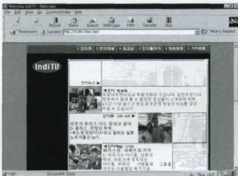
〈그림 1〉 유치원 인터넷 생중계 사이트 초기 화면

일반 극장이나 방송에서 볼 수 없는 독립 다큐멘터리, 애니메이션 등을 24시간 방송하는 곳도 있다. 한국통신하이텔은 5월 독립영화 전문방송인 '인디'를 개국, 제28회 베를린 영화제 뉴시네마 부문 초청작인 '동시에' 등 국내 30여개 영상단체가 제작한 작품을 업선해 방송하고 있다.