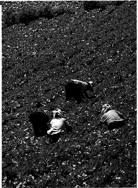
이제 일채소 전용농약 개발로 생산농민들의 걱정은 한시를 덜게 되었으나 무엇보다 그들의 노고에 감사하는 마음을 가져야 한다.

를 얻지 못하고 있는 실정이다. 이유는 채소류 등 농산물의 잔류농약검사에 오랜 시간이 걸려 소비자가 농산물을 소비한 뒤에야 「적합」 또는 「부적합」판정이 났기 때문일 것이다.