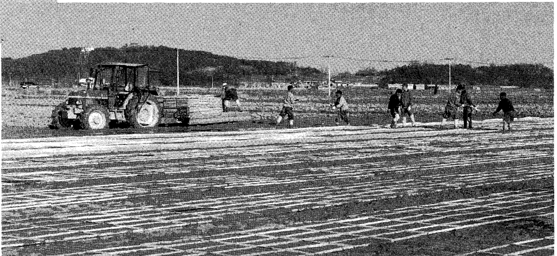
최근들어 못자리 설치 시기가 점차 빨라지고 있어 생육장애 및 뚝모·잘록병 등의 발생이 우려된다.

우리나라의 장려품종은 91개 품종이 재배되고 있다. 이 중 500kg 이상 품종수가 44개이며 경기도 장려품종만도 34개나 된다. 이렇게 많은 품종 가운데서 내가 무엇을 심을 것