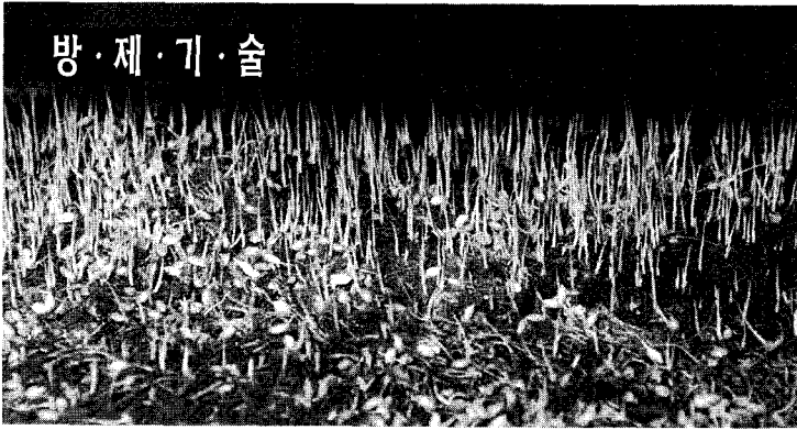
대부분의 농가에서는 결주발생 방지와 상지수를 줄일 목적으로 밀파를 하고 있으나 이는 모가 연약하고 활착불량 등의 원인이 된다.

기해충인 벼물바구미, 벼잎굴파리류의 피해가 클 경우에는 재이앙하는 경우도 있으므로 밀파되지 않도록 해야 한다. 또한 한포기에 알맞는 모수는 3~5개인데 이앙 직후 살펴보면 15~20개의 모가 1포기에 심겨지는 경우도 볼 수 있다.