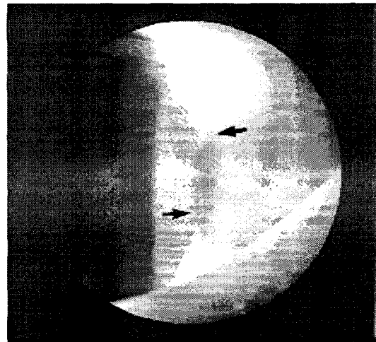
Fig 3. Slit lamp examination reveals cells (arrows) in the anterior chamber.