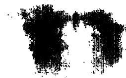
Fig. 4, Chronic Paranasal Sinitis(during Treatment)

鼻鍼 治療前 狀態와 治療後 狀態를 比較하여 鼻塞, 鼻漏, 頭痛 等の 症狀改善과 鼻鏡檢査나 X-ray