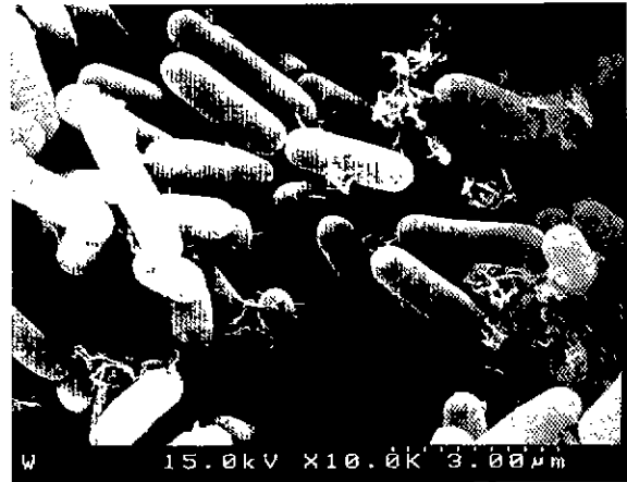
Fig. 2. Scanning electron micrograph of the isolate sp W3712.

of Systematic Bacteriology (7)의 방법에 따라 등정한 결과, 그람 양성 무포자 간균으로서 비운동성이며 catalase양성이며 indol을 생성하지 않는다는 점 등으로 Corynebacterium 으로 밝혀졌다. 이 Corynebacterium 은 포도당, 과당, maltose, trehalose 등으로부터 산을 생성하지 않으며 esculin을 분해하지 못하고 nitrate을 환원 하며 urea 양성, methylred 음성, 생육최적온도가 37°C라는 점 등의 특성으로 Corynebacterium pseudodiphtheriticum W3712로 명명했다.