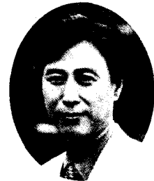
조 균 형

건축물에서의 전과정 평가(LCA : life cycle assessment)에 대하여 살펴보고 건축설비에서의 LCA 개념을 소개하고자 한다.