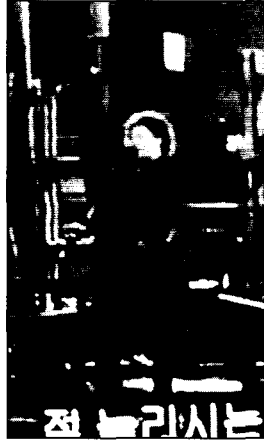
〈사진12〉 Bloomer costume 영화 오스카와 루신다