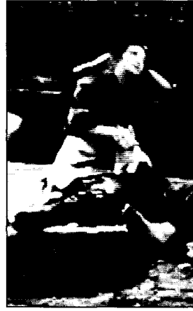
〈사진13〉 Bloomer costume 영화 오스카와 루신다