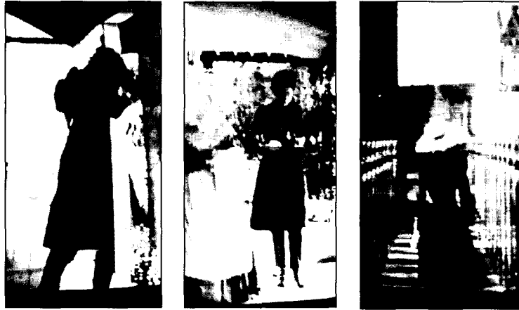
〈사진3〉 Bloomer costume, 영화 오스카와 루신다 〈사진4〉 Bloomer costume ⊕ Front 영화 오스카와 루신다 〈사진5〉 Bloomer costume ⊕ Back 영화 오스카와 루신다