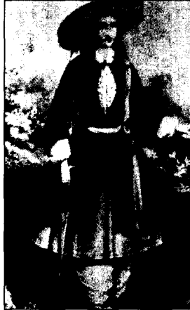
<사진1> Amelia Bloomer(1851) Anderson Black: A History of Fashion, p.274