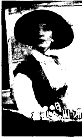
〈사진14〉 Hat in bloomer costume 영화 오스카와 루신다