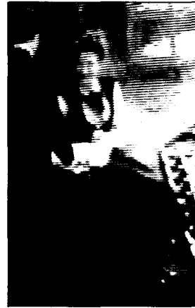
〈사진15〉 Bloomer costume 영화 오스카와 루신다