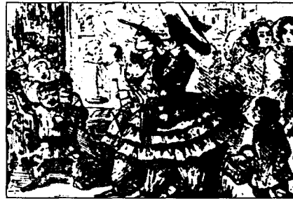
<사진2> 풍자된 Bloomerism(Punch誌, 1851) 村上憲司: 西洋服裝史, p.186

19세기 말 블루머 의상은 외출복으로 조롱을 받았기 때문에 급진적인 여성들도 몇 해 착용하다가 벗기 시작하였다. 그러나 이 블루머 의상은 사회적으로 여성들의 바지 착용이 인정되기까지 그 과도기적 역할-예를 들면, 집안일을 하는 가사복, 요양복, 스포츠복 등으로 애용됨-을 담당하여 왔다. 그 당시 여성들의 스포츠웨어로써 싸이클링복, 수영복, 테니스복 등에 블루머 의상이 응용되어 스포츠웨어에 바지가 정착될 때까지 이용되었다. 23)