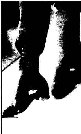
〈사진10〉 Trousers in bloomer costume