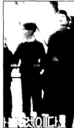
〈사진11〉 Bloomer costume 영화 오스카와 루신다