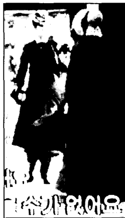
〈사진6〉 Bloomer costume ⊕ Front 영화 오스카와 루신다