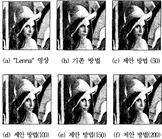
그림 1 lena 영상에 대한 압축 복원 결과

기존의 방법과 제안된 방법으로 생성한 프랙탈 코드를 복원한 결과 영상이 그림 1(b)~(f) 와 그림 2(b)~(f)에 제시되어 있다. 기존의 알고리즘들에서는 부호화 시간의 단축에 따른 복원 품질 저하가 발생하나 제안된 알고리즘은 결과에 거의 영향을 주지 않는 불필요한 도