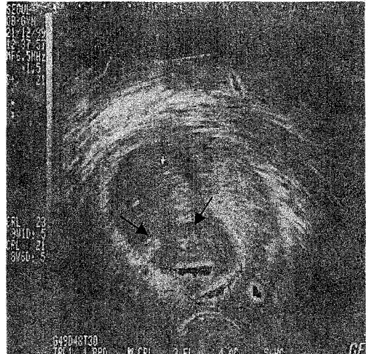
Figure 2. Two fetal heart beats are shown in one gestational sac.

유O영씨는 35세, 임신 15주 5일로 출산력은 3-1-1-0-1이고, 월경주기는 27일로 규칙적이었고, 지속 일수는 3~4일, 양은 중등도 였다. 과거력상 34세 때 좌측 난관임신으로 좌측 난관절제술을 받은 병력이 있었다. 1999년 12월 17일 10개의 배란전 난포를 얻고 배아이식 5일째인 12월 22일 2개의 배반포 (blastocyst)를 배아이식하여 임신이 된 환자로 염색체 검사 및 양수 검사 위해 본원 외래로 내원해 시행한 복부초음파 검사상 양측 양수강 사이에 막은 형성되어 있지 않았고, 양 태아의 심박동은 보이지 않았으며 두정골 간격도 양측 태아에서 차이를 보이지 않았으며 양측 모두 두정