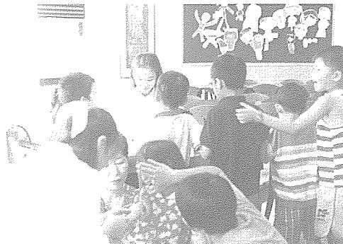
▲ 충북지부는 8월중 농협 지역 본부, 화양동 유원지, 해능 보육원 등에서 시민과 보육원생 200여명에게 기초 검사, 콜레스테롤, B형 간염 등 건강 검진을 실시했다.