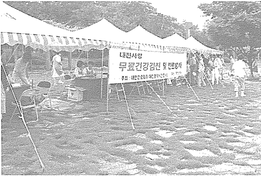
▲ 대전·충남지부는 지난 8월 4일 서대전 공원에서 대전광역시 간호사회와 합동으로 시민을 대상으로 사랑의 진료 봉사를 실시했다. 이번 행사에서 시민 150여명에게 무료 검진과 건강 상담을 실시했다.