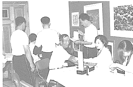
▲ 경북지부는 8월중 영덕군 병곡면에서 지역 주민 50여 명을 대상으로 기초 검사, 혈액·콜레스테롤·혈당 검사 등 건강 검진을 실시했다.