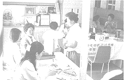
▲ 부산지부는 지난 8월 5일부터 19일까지 한국 까루푸 해운대점, 광안리·해운대 해수욕장, PSB 방송국 등에서 영세 시민, 해수욕객 등 750여 명을 대상으로 무료 검진을 실시했다.