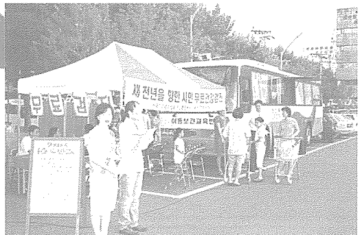
▲ 대구지부는 지난 8월 28일~9월 2일까지 대구 시민이 많이 모이는 대형 할인 매장 3곳에서 지역 주민들을 대상으로 순회이동보건교육 및 무료건강검진, 건강상담을 실시했다.