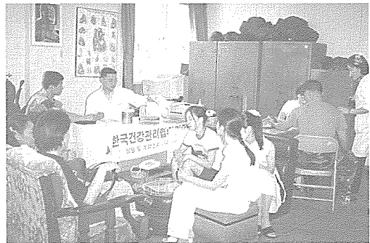
▲ 전북지부는 8월중 군산시 재활 사업장에서 시각 장애인과 육군 제7358부대 영의 거주자 가족, 전주시 지역 주민 등 150여명에게 무료건강 검진을 실시했다.