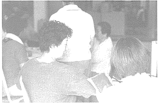
▲ 부산지부는 지난 8월 21일~23일까지 부산시 안나·청학·은애 모자원 등을 방문하여 150여명에게 기초 검사, 혈액 질산·심장·B형 간염 검사 등 건강 검진을 실시했다.