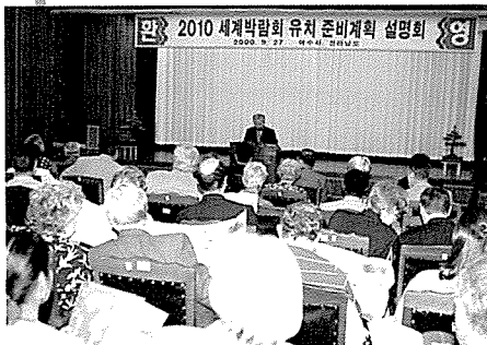
주한 외교 사절단 초청, 전남의 문화유산, 2010세계박람회 유치 배경 등을 설명