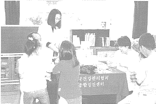
▲ 한국건강관리협회 시·도 지부는 지난 9월 중 200여 초·중·고 3천여 중식 지원 학생을 대상으로 무료 건강 검진을 실시했다.

아픔은 나눌수록 적어지고 사랑은 나눌수록 커진다고 했다. 지금이 바로 서로 조금씩 나누는 마음을 가져야 할 때가 아닐까 생각한다. 어려움을 매일수록 힘들고 고통받는 사람들, 그러나 열심히 살고자 노력하는 이들에게 조금이나마 관심을 가져 주는 마음이 더욱 소중한 것이다. 이 아름다운 마음이 희망을 잃었던 이들에게는 '사랑의 손길' 되어 다시 힘과 용기를 주어 더 밝고 환한 세상을 만드는 빛과 소금이 되어 줄 것이다. 지난 9월 중 한국건강관리협회는 교육청의 협조를 얻어 초·중학교 중식 지원 학생 3천여 명을 대상으로 무료 건강 검진을 실시했으며, 이외에도 전국의 여러 현장에서 무료 건강 검진이 이루어졌다.