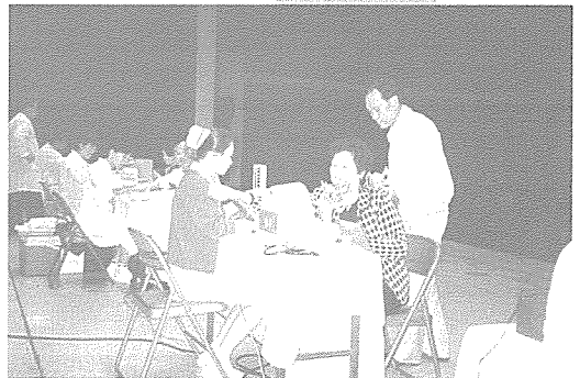
▲ 부산 지부는 지난 9월 26일부터 27일까지 KBS부산 방송총국과 공동 주최로 영세 시민 대상 무료 건강 검진을 실시했다.