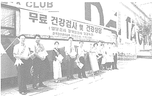
▲ 대구 지부는 지난 9월 한달 동안 동대구 지하철역, 한국 까르푸 등에서 대구 시민을 대상으로 기초·당뇨·고지혈증·심장 질환 검사 등 무료 건강 검진과 상담을 실시했다.