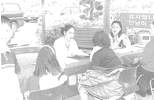
▲ 충북 지부는 농협 지역 본부에서 지역 주민을 대상으로 무료 건강 검진을 실시하였으며, 해원 학교 학생 100여 명에게도 무료 검진 및 상담을 실시했다.