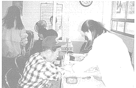
▲ 부산 지부는 사회 복지과의 협조를 얻어 맹인 복지관과 어진샘 노인 복지관을 방문하여 90여명에게 기초 검사, 요 화학, 혈액 질환, 간 기능, 당뇨, 고지혈증, 심장 질환, B형 간염 등 무료 건강 검진을 실시했다.