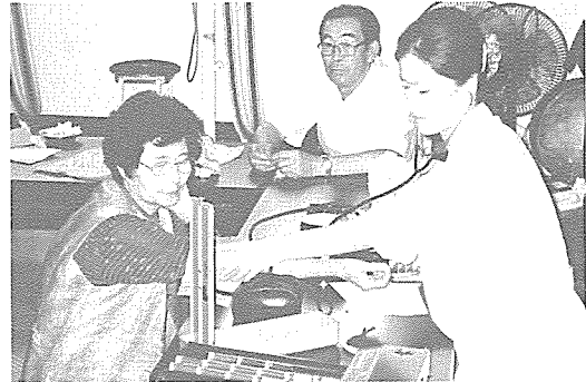
▲ 제주 지부는 제주시 영평동 태풍 피해로 인한 수해 복구 지역과 서귀포시 상예동 하수 종말 처리장 지역 주민 등 90여명을 대상으로 무료 건강 검진과 건강 상담을 실시했다.