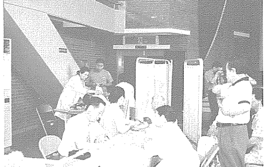
▲ 광주·전남 지부는 영광군 장애인 복지관 90여명, 성 요셉 양로원 80여명 등에게 무료 건강 검진 및 건강 상담을 실시했다