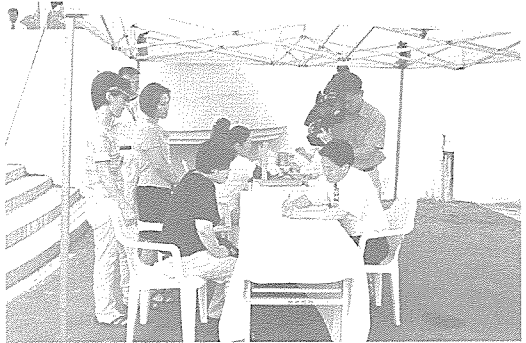
▲ 전북 지부는 임실군 강진면 지역 주민 30여명, 순창 군민 회관 직원 12명, 전주 소망 요양원 50여명 등을 대상으로 기초·혈액 질환·간 기능·B형 간염 등 무료 건강 검진과 건강 상담을 실시했다.