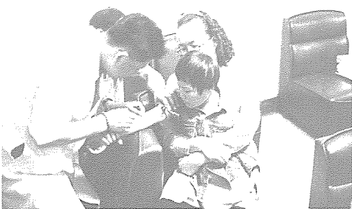
▲ 강원 지부는 춘천 시내 강원 재활원을 방문하여 수용자 120여명에게 무료 건강 검진을 실시하였다.