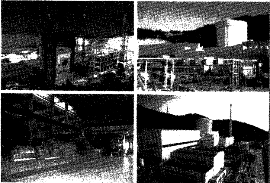
중국 진산 원전 유니트. 현재 진산 원자력 단지에는 중수로형 원자로인 진산 3단계(TQNPC) 건설 공사에 한전 직원이 캐나다원자력공사(AECL)의 일원으로 일부 기술 지원 용역중이며, 발전소 운전원에 대한 중수로 운전 교육을 한전에서 수행중에 있다.

발전소의 정비 체제 구축을 위하여 발전소 보수 조직을 분리하여 별도의 회사 설립을 추진중이며, 현재 그 방법 검토에 고심하고 있는 과도기 상태라 할 수 있다.