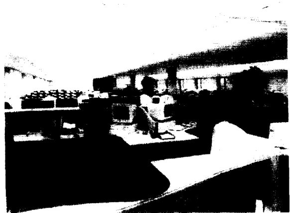
[그림 4] 써모덱 시스템이 설치된 사무실 공간

로만 출입을 하게 하였다. 시각적으로 감지할 수 있는 허리높이의 안전문을 접견실 출구에 설치하였고, 카드리더기에 신분카드를 해독하지 않고 지나가면 경보가 울리게 하였다. 완벽한 시스템의 작동은 세가지 목적을 만족하는 크레딧카드 형태인 고기술로 작동하게 하였다. : 시각, 전자 ID, 크레딧 시스템.