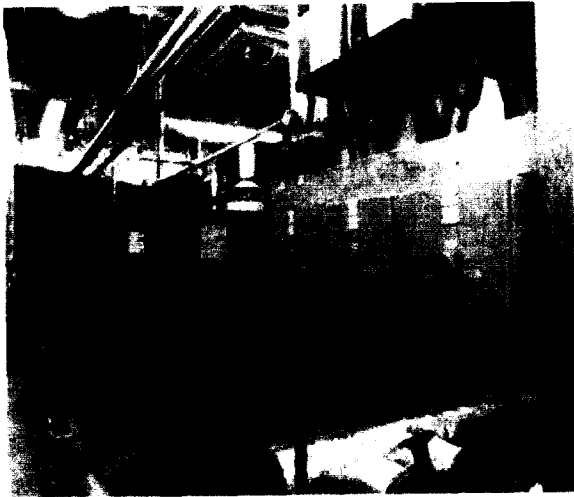
[그림 3] 3층 기계실 내부(2대의 콘덴싱 보일러가 설치)