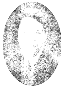
김철성 (전북대학교 전자정보공학부 조교수)