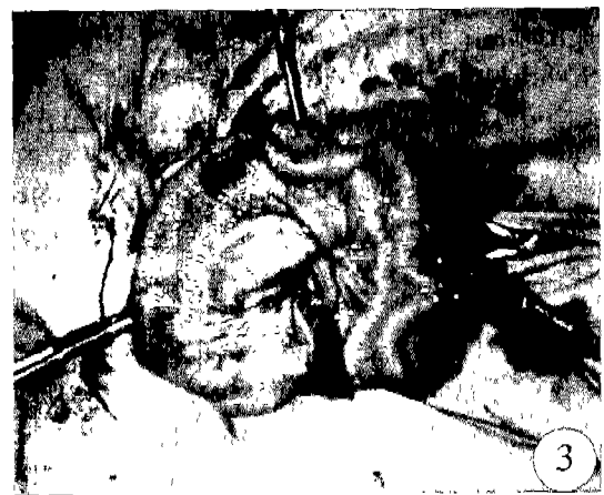
Fig 3. Enterostomy under electroacupuncture anesthesia using Tian-ping and Bai-hui acupoints(the exposed intestines are observed).