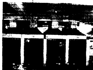
App. Fig. 1. Example on the asymmetrical exhaust system.