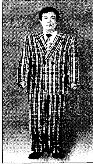
〈그림 17〉 더블여밈 비만체형 체크무늬