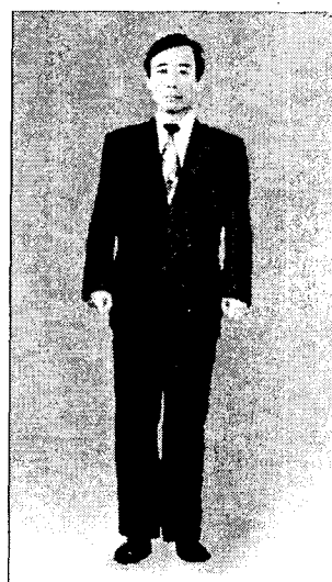
〈그림 3〉 싱글여밈 마른체형 민무늬