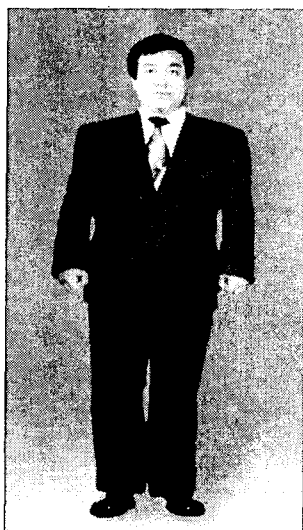
〈그림 2〉 싱글여밈 비만체형 민무늬