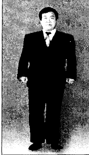
<그림 5> 더블여밈 비만체형 민무늬