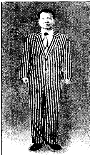
<그림 7> 싱글여밈 표준체형 줄무늬