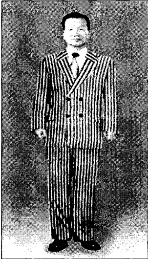
<그림 10> 더블여밈 표준체형 줄무늬