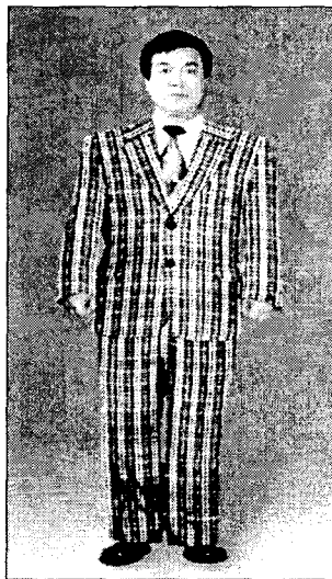
<그림 14> 싱글여밈 비만체형 체크무늬