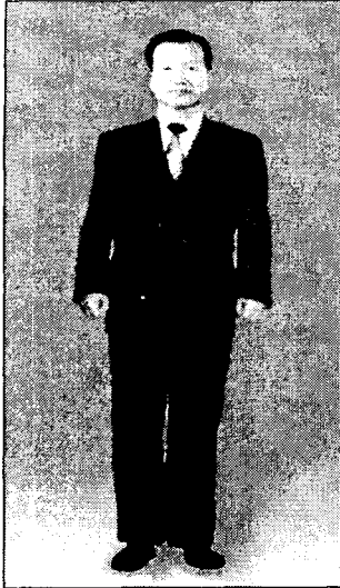
<그림 4> 더블여밈 표준체형 민무늬