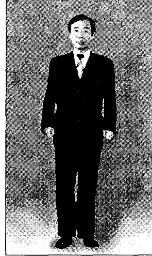
<그림 6> 더블여밈 마른체형 민무늬