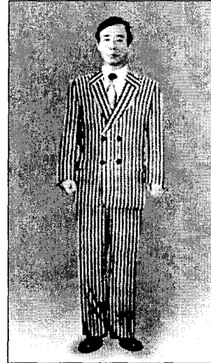
<그림 12> 더블여밈 마른체형 줄무늬