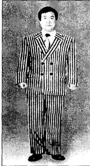
<그림 11> 더블여밈 비만체형 줄무늬