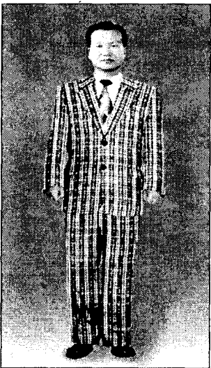
<그림 13> 싱글여밈 표준체형 체크무늬