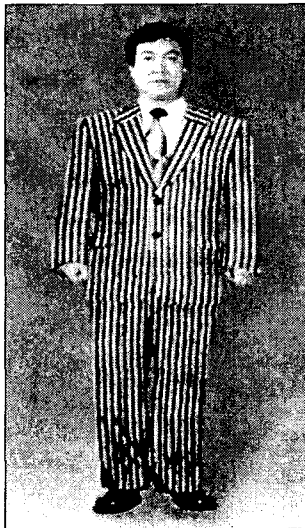
<그림 8> 싱글여밈 비만체형 줄무늬