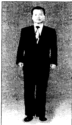
〈그림 1〉 싱글여밈 표준체형 민무늬

연구대상자의 성별은 남녀 각각 358명(50%)이며, 연령은 20~29세가 183명(25.6%), 30~39세가 180명(25.1%), 40~49세가 178명(24.9%), 50~59세가 175명(24.4)%로 성별, 연령별로 비교적 고른 분포를 보였다.