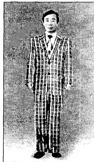
<그림 15> 싱글여밈 마른체형 체크무늬