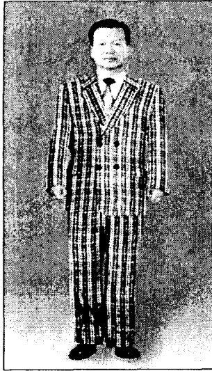
〈그림 16〉 더블여밈 표준체형 체크무늬