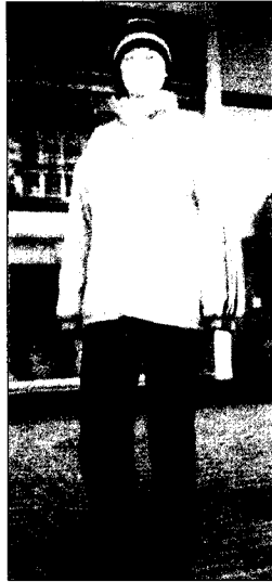
<그림 5> 중국패션거리