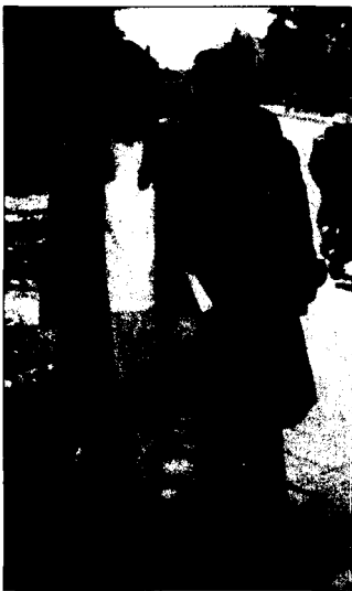
〈그림 1〉 한국 캠퍼스