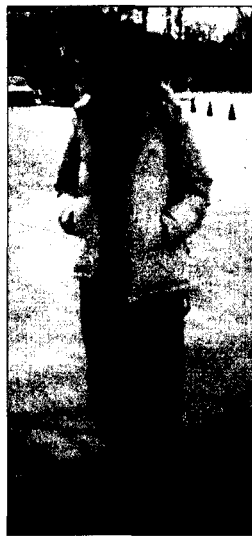
〈그림 2〉 한국 패션거리