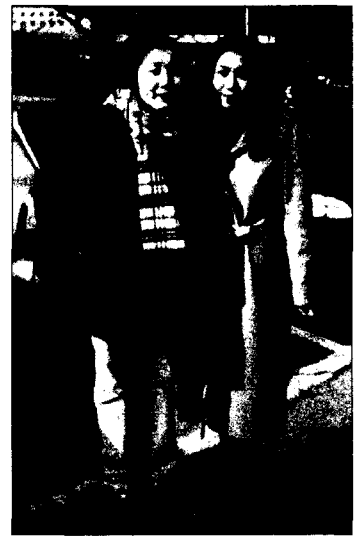
〈그림 3〉 한국 캠퍼스

사진이 계측된 장소는 중국은 북경복장학원등의 캠퍼스내에서 44%, 북경 시내 왕부정거리등에서 56%를 촬영하였으며 한국은 건국대, 이대, 홍대등