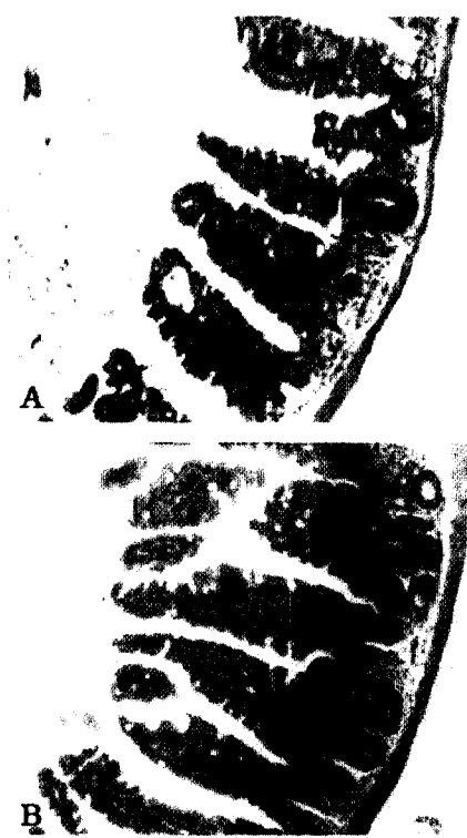
Fig 1. Photomicrograph of transverse sections of mouse jejunum. (A) 3.5 days after 12 Gy of gamma radiation. H-E stain, X 40. (B) 3.5 days after 12 Gy of gamma radiation treated with effective material. The number of surviving crypts was significantly increased compared with those in the irradiation control.

*p<0.005, **p<0.0005, ***p<0.05 as compared with irradiation control group.