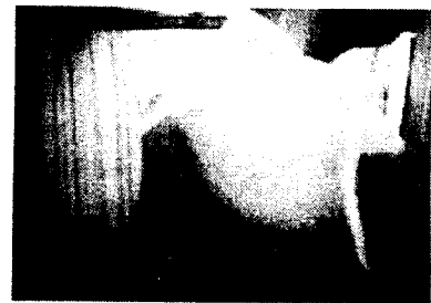
그림 3. 측면