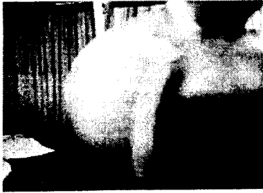
그림 4. 사면