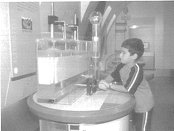
'물리과학 갤러리'에서 동작전시물을 조작하고 있는 어린이

싱가포르 사이언스센터는 과학과 기술에 대한 흥미와 창의력을 유발하고 과학기술분야의 지식을 함양하기 위해 건립되었으며, 싱가포르의 과학 수준과 현대과학의 현주소를 한 눈에 볼 수 있는 곳이다. 전시관은 '아트리움